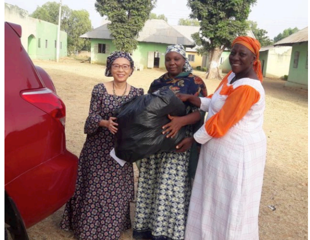
上圖：探訪和捐贈 Jura 衛生護墊給在 Tofa 的 ECWA 神學院的 48 位婦女 (包括學生和教師)

註：很感謝你閱讀我的通訊。我期望得到你的消息和能為你禱告。請電郵 judyhowc@gmail.com 。如你願意在經濟上支持我或我的事工，請電郵我以獲取進一步的資料。